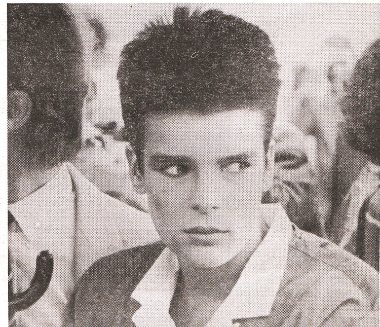
Stéphanie de Monaco venue en personne féliciter les concurrents.