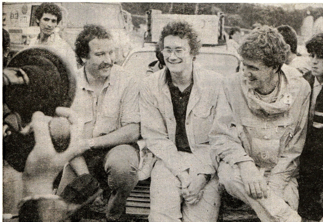
L'équipage vainqueur: RTL.

Premier équipage RTL (Belgique): prix de 80000 FF. Deuxième équipage SRC (Canada): prix de 20000 FF. Troisième équipage TMC (Monaco). Quatrième équipage SSR (Suisse romande). Cinquième équipage A2 (France). Prix de la meilleure participation image: équipage SSR (Suisse romande); prix de 20000 FF. Prix spécial de la Prévention routière: équipage TMC (Monaco). Prix d'honneur.