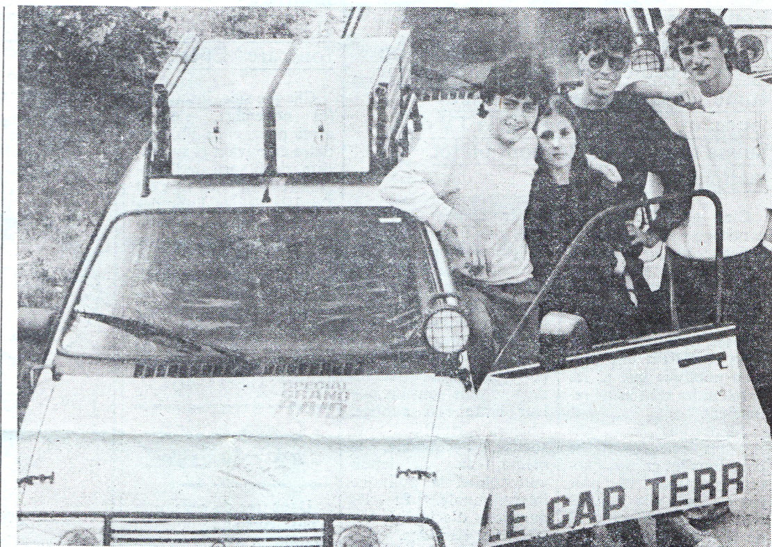
Les quatre concurrents suisses avec leurs voitures 4 x 4.