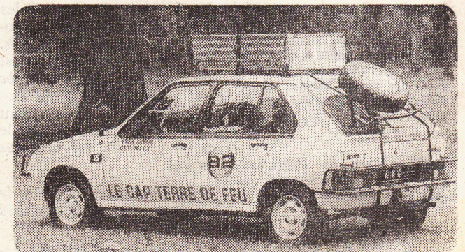
Un véhicule spécialement aménagé et repensé à partir du modèle Visa de Citroën.

Aménagements spéciaux: réservoir de grande capacité: 100 litres; arceau de sécurité; treuil électrique arrière; support extérieur pour deuxième roue de secours; pare-buffle AV et AR; phare de poursuite; galerie porte-conteneurs et tôles de désensablage; support caméra vidéo; caisson anti-vibration dans l'habitacle arrière pour le transport du matériel vidéo; alternateur de batterie haute capacité; plaques de protection des carters; pneumatique 175 x 70 XM + S.